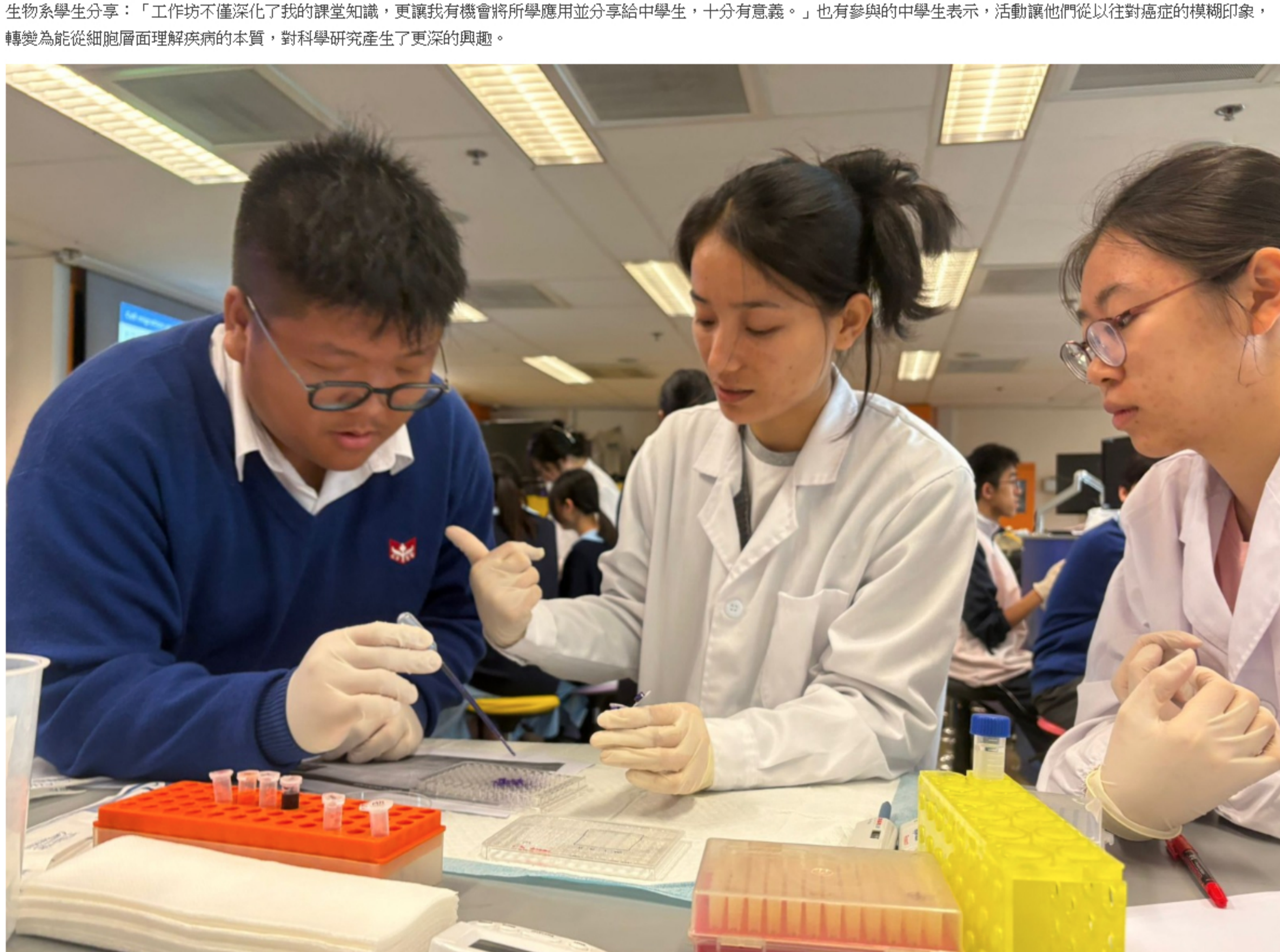
這次跨校學習活動不僅促進了大學與中學生之間的知識交流，也展現了「服務學習」與「從課堂走進大學實驗室」教學模式在培育青年及推動科學教育上的潛力與價值。主辦團隊期望未來持續舉辦類似活動，讓更多學生接觸生物醫學，培育科研人才，同時強化科學教育與社會的連結。

余英傑博士表示：「透過服務學習，我們希望讓大學生將所學回饋社會，同時帶領中學生接觸前沿科學，激發他們對生物學與生物醫學的興趣，為未來培育人才。」有參與教學的生物系學生分享：「工作坊不僅深化了我的課堂知識，更讓我有機會將所學應用並分享給中學生，十分有意義。」也有參與的中學生表示，活動讓他們從以往對癌症的模糊印象，轉變為能從細胞層面理解疾病的本質，對科學研究產生了更深的興趣。