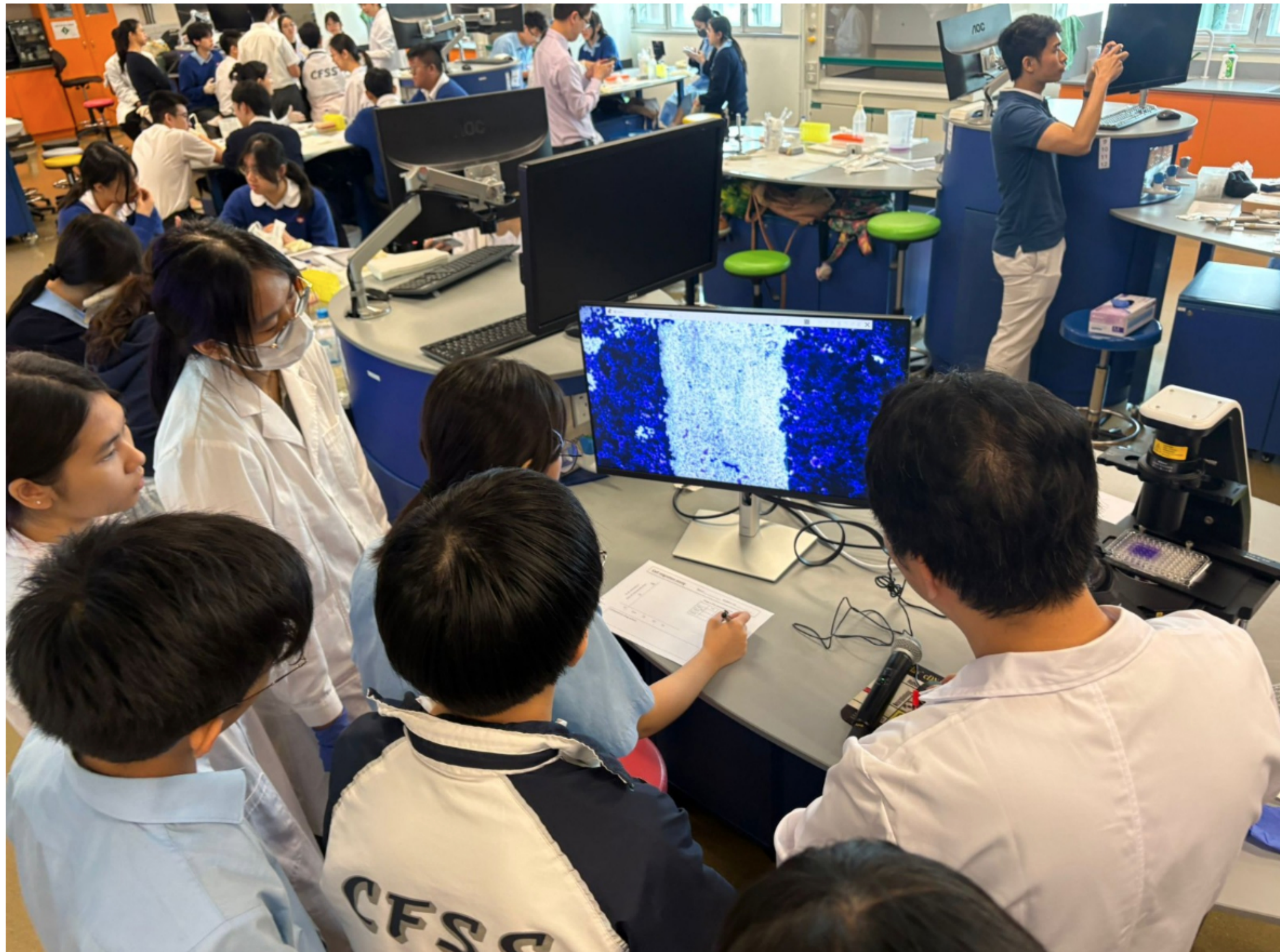
工作坊以「從課堂走進大學實驗室」為主題，結合理論講解與實作體驗，讓中學生親身感受科研歷程。內容涵蓋三大範疇：癌細胞生長、癌細胞遷移，以及組織學研究。在浸大團隊指導下，學生使用數碼顯微鏡觀察癌細胞形態與生長狀況，理解癌細胞異常增生的特徵，並學習藥物如何阻止癌細胞擴散至人體其他組織，深化對癌症的認識。